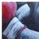
1 Boxeur aux gants rouges 65x81