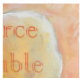
4 Le courage de se relever 30x60