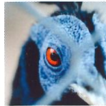
1 Sauvage 40x60

La force est là. A chaque instant, elle se présente aux yeux de celui qui la cherche. Brute naturellement, elle est primitive, sauvage, instinctive. Mais elle se cache. Fragile, la force se laisse toucher, apprivoiser, ou non. Car la force part, comme elle est venue. Elle traverse. Sa violence intérieure la rend magnétique. Telle une vertu, le courageux s'exerce à l'entretenir dans l'ultime espoir de la maîtriser. Mais elle ne saurait être acquise ni contenue pour toujours. Elle est. Généreuse, elle se donne et se déploie. La force est vitale. Je la cherche en attendant de savoir la recevoir pour enfin, la contempler.