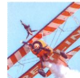
7 Balade entre copines 50x75