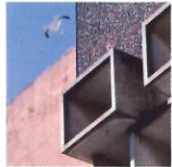
1 DDTM Toulon 2017 - 40x60 cm

Le rouge vient mettre en lumière des détails.