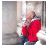
2 L'attente 50x75