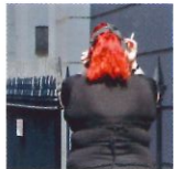
2 La dame aux cheveux rouges Londres 2011 - 40x60 cm