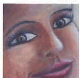
5 Force d'un regard 38x46