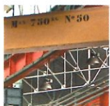
5 Plateau des Capucins Brest 2012 - 40x60 cm

La force est là. A chaque instant, elle se présente aux yeux de celui qui la cherche. Brute naturellement, elle est primitive, sauvage, instinctive. Mais elle se cache. Fragile, la force se laisse toucher, apprivoiser, ou non. Car la force part, comme elle est venue. Elle traverse. Sa violence intérieure la rend magnétique. Telle une vertu, le courageux s'exerce à l'entretenir dans l'ultime espoir de la maîtriser. Mais elle ne saurait être acquise ni contenue pour toujours. Elle est. Généreuse, elle se donne et se déploie. La force est vitale. Je la cherche en attendant de savoir la recevoir pour enfin, la contempler.