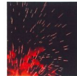
6 Feu follet 40x40