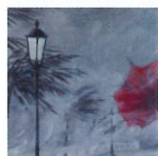
2 Tempête sur l'humanité 30x60