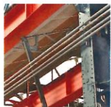
4 Plateau des Capucins Brest 2012 - 40x40 cm