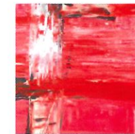
2 Force mentale 70x90