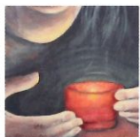
3 Lueur contre ténèbres 50x61