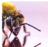
3 Mouche à miel 50x75