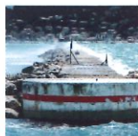
5 Fortifier 50x75

Imprégnée de notre réflexion commune sur la force brute, je laisse le geste prendre le relais à travers la peinture.