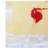
1 La force du geste 100x100

Mon interprétation de la force est saisie sur le vif par une couleur, un contraste, un mouvement... Et par la force du geste, l'oeuvre prend forme. Elle invite à la rencontre, au dialogue celui qui la regarde. Elle lui ouvre une porte vers l'imaginaire et la rêverie.