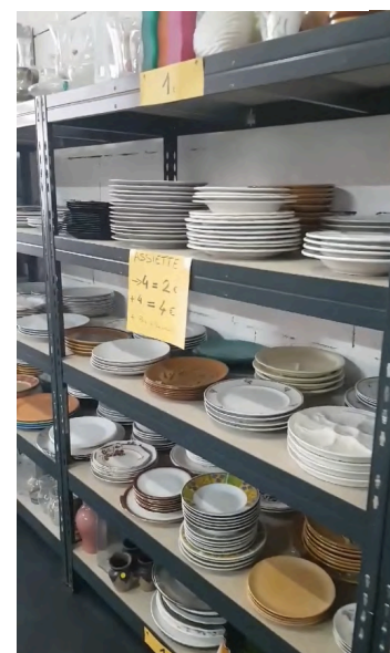
La Ressourcerie dans tous ses états !

Ce fut aussi l'occasion de s'atteler à la résolution de 3 fuites d'eau, de réparer des portes, des volets électriques, penser à l'accueil des clients, trier, recycler, classer, étiqueter ... Travailler avec nos partenaires sur la traçabilité des matériaux transitant par la Ressourcerie, créer cette lettre d'information, travailler notre communication et notre signalétique (merci Didier Bouthillier !), mettre à jour notre Facebook ( https://www.facebook.com/laressourceriedelarade/ ) etc. La Ressourcerie a participé également à d'autres missions pour soutenir les autres associations de l'UDV (distribution de repas à la Résidence solidaire Les Favières par exemple...). Bref, des jours très denses où, entre télétravail et mains dans le cambouis, la Ressourcerie turbinait, bouillonnait et boulonnait !