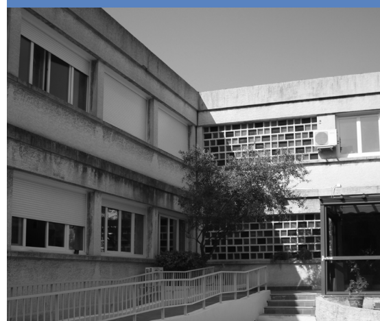
La résidence solidaire «Les Favières»