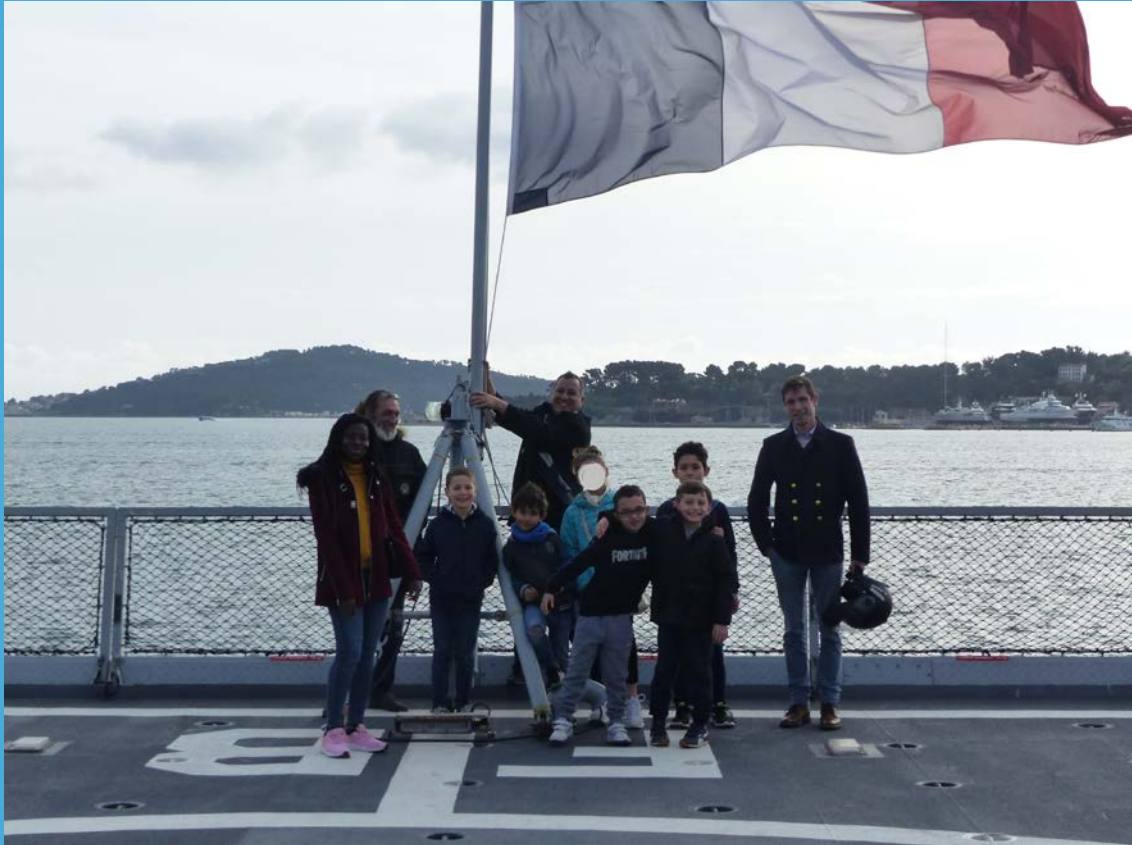
La Frégate "le Forbin" - Arsenal de Toulon - avec les primaires de l'aide aux devoirs