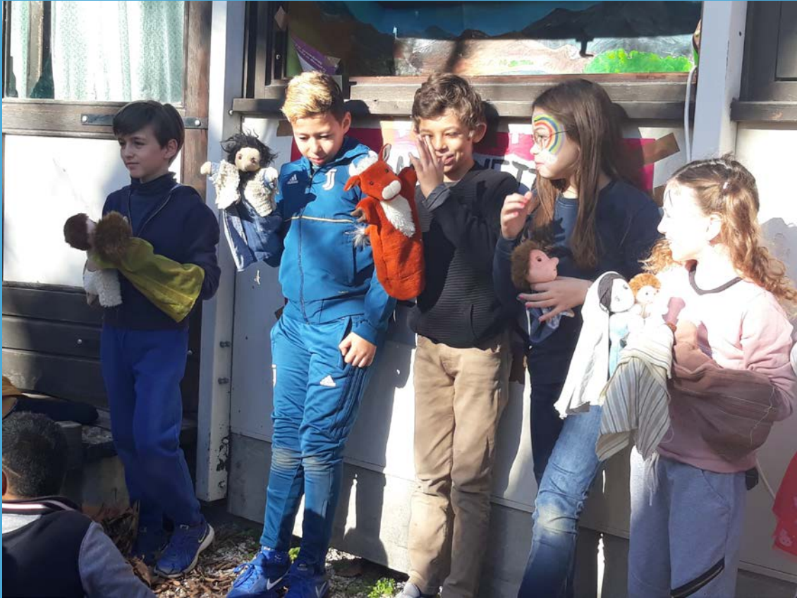
Fête de Noël - Les enfants ont offert un spectacle de marionnettes aux parents