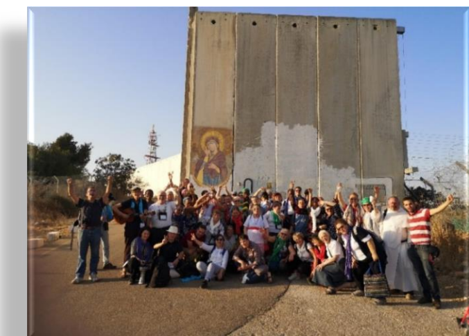
Icône de « Notre Dame qui fait tomber les murs » écrite sur le « mur » à Bethléem, devant le monastère de la Communauté des sœurs de l'Emmanuel.

« Ne rentrez pas chez vous comme avant. Ne vivez pas chez vous comme avant. Changez vos cœurs, cassez vos peurs. Vivez en hommes nouveaux ! ».