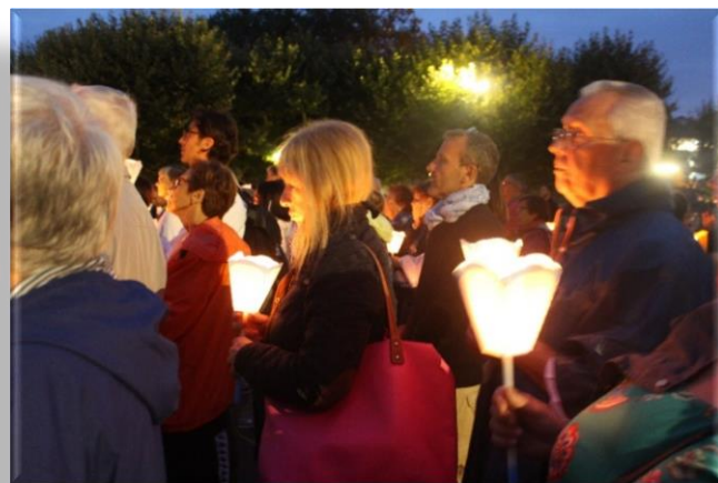
Pèlerinage Saint Laurent – août 2018