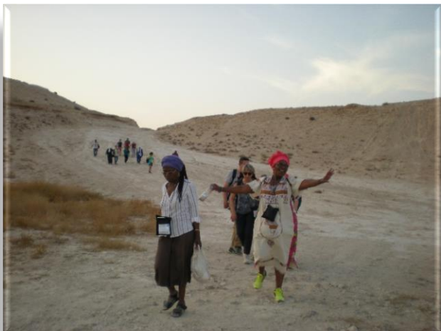
Comme le Christ, marcher dans le désert de Judée, en route vers Jéricho...

Dans une sorte de chapelle de plein vent abritée par un toit de paille et de tôle, les trois prêtres qui ont accompagné le pèlerinage célèbrent autour d'un autel de pierre brute la dernière messe du séjour.