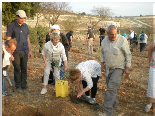
Rencontre de l'Association « Tent of Nation » en Cisjordanie. Aide à la replantation.