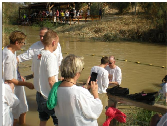
Plonger dans l'eau du Jourdain. Évocation du baptême de Jésus.

les montagnes dans une ombre bleutée. 2 000 ans plus tard, le paysage est quasiment identique à celui que Jésus a contemplé. Il règne en cette fin de journée à Tabgha, au bord de la mer de Galilée (plus connue sous le nom de lac de Tibériade) une paix presque irréelle. Aucun signe de modernité, si ce n'est le klaxon lointain d'un autocar.