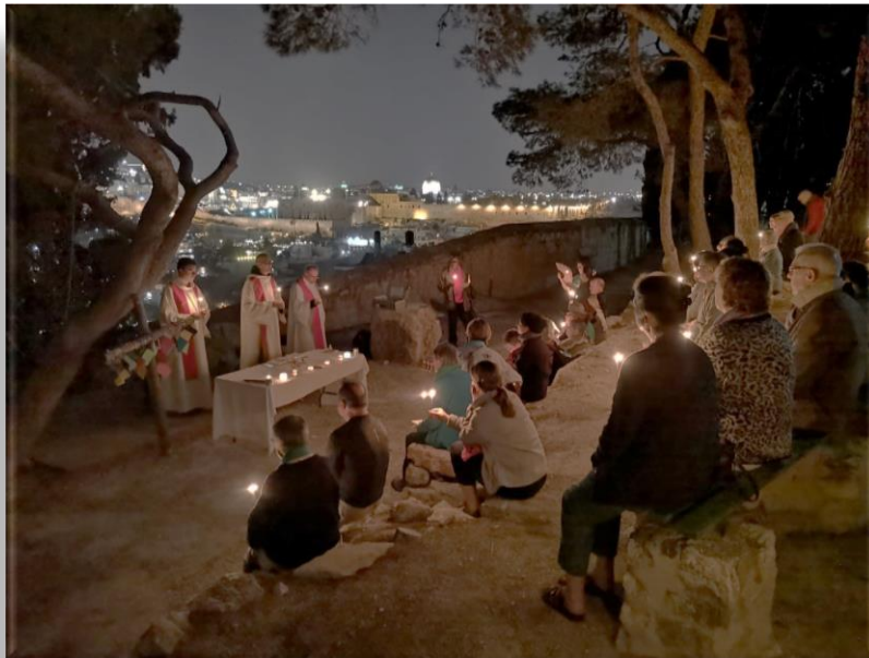
Célébration devant Jérusalem, sur l'esplanade de la Maison d'Abraham.