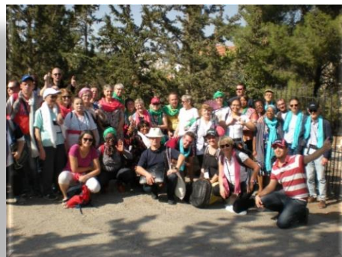
Les pèlerins du 1 o péle en Terre Sainte du Réseau Saint Laurent

« Des roselières peuplées d'oiseaux. Le miroir du lac reflétant le ciel et en face, au soleil couchant,