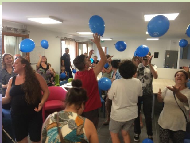
Tableau d'expression lors d'un « apéro du vendredi » et temps d'inclusion lors du 1 er Conseil des Habitants