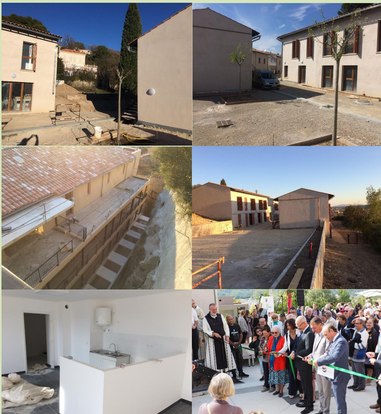
De la fin des travaux jusqu'à l'inauguration.

Un premier bâtiment se trouve sur l'avenue de Grasse. Il présente 3 étages sur un rez-de-chaussée faisant office de parking. Une cage d'escalier avec ascenseur communique par une passerelle avec les 3 autres bâtiments situés sur le plateau au-dessus. Ces 3 bâtiments sont faits d'un rez-de-chaussée et un étage. Ils s'articulent autour d'une placette et d'une petite rue centrale.