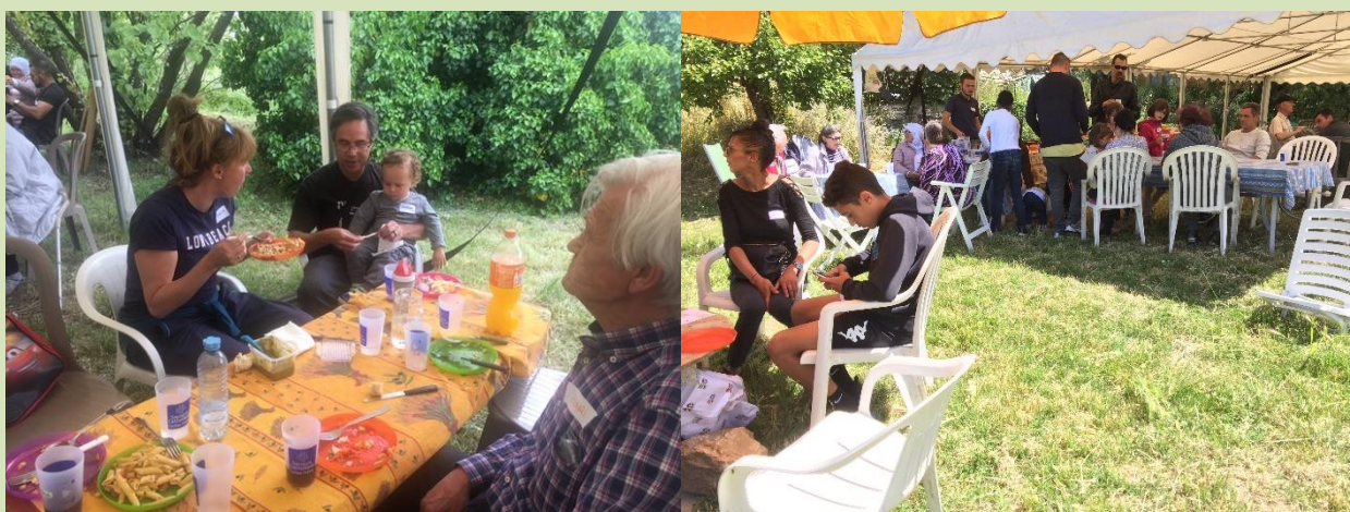
Le pique-nique du 11 mai autour des futurs habitants du Hameau Saint-François