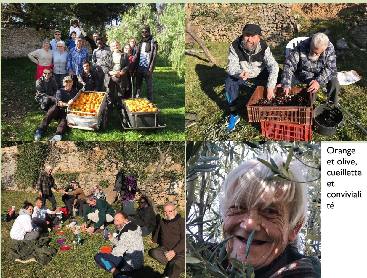
Orange et olive, cueillette et convivialité

Comme chaque année, un séjour de 3 jours a été organisé sur l'île de Lérins avec 18 personnes pour ramasser les oranges et confectionner la confiture. C'est un temps fort pour les personnes qui ont participé.