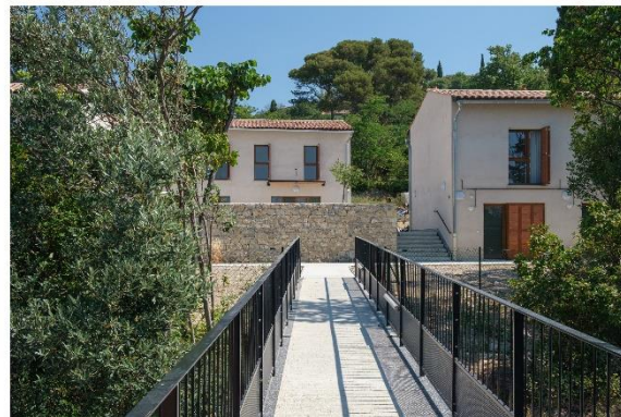
© Atelier Pirollet – Le Hameau Saint-François – juin 2019